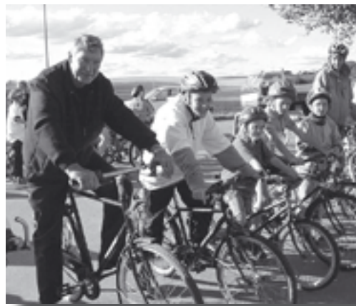
Cykelsponsorløb for friskolen.

Så er vi nået frem til udviklingsværkstedet, som blev afholdt i Oplev d. 10. januar 2005, dagen efter den store storm.