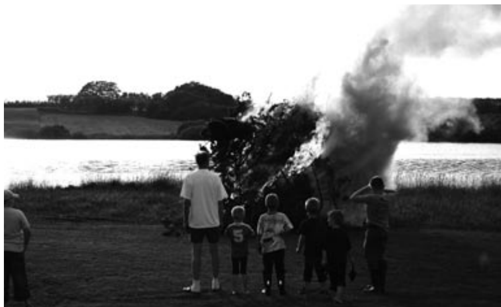
Børnenes fakler tændte bålet i Sørup.