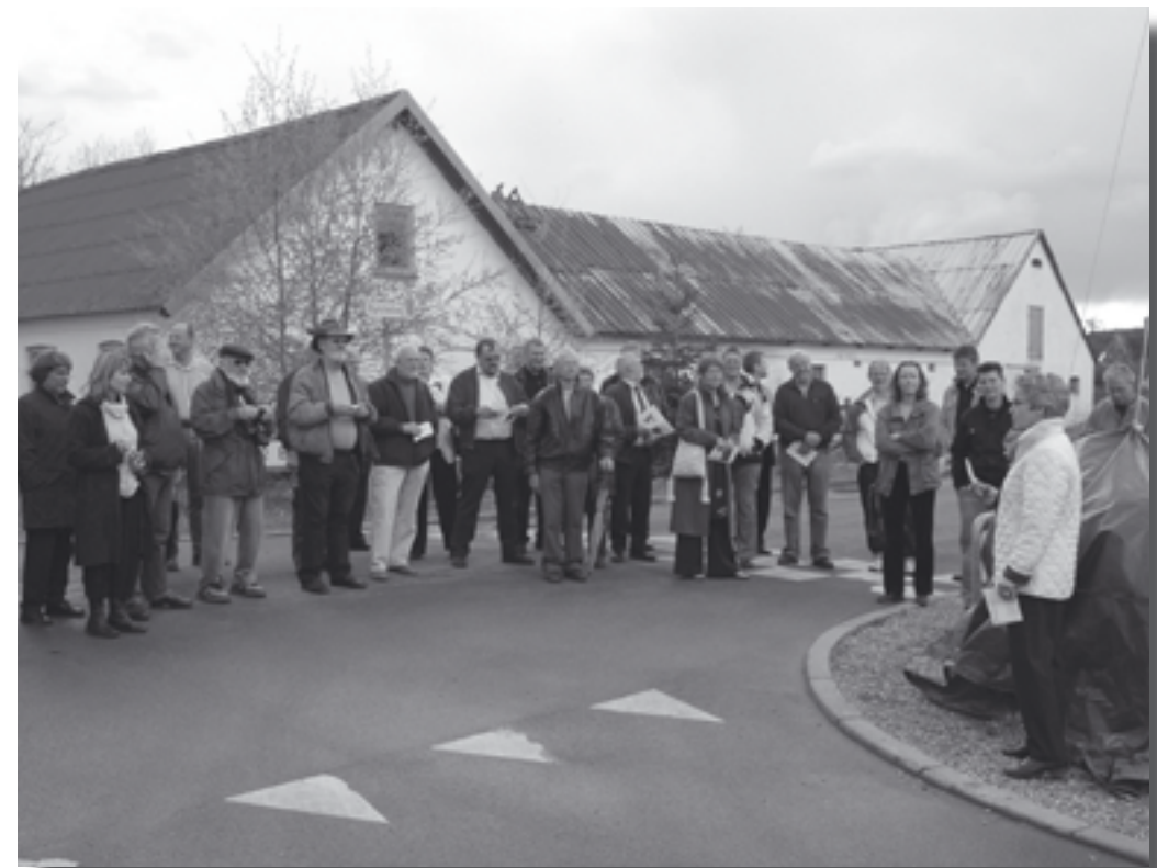
Indvielsen af Byrsted stenen.

Alle steder var der repræsentanter for de lokale beboerforeninger til stede, der fortalte om de mange projekter, der var i gang rundt omkring.