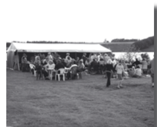
Over 250 kom til Skt. Hans i Sørup

Et par af områdets beboere har været ude i Hjeds Kær og har ryddet stien. De har desuden ryddet flere stikveje og lagt små broer over vandløbene, så en spadseretur i Kæret er en endnu bedre oplevelse end den plejer at være.