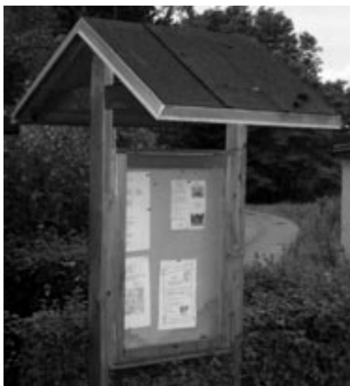
Opslagstavlehuset i Hjedsbæk