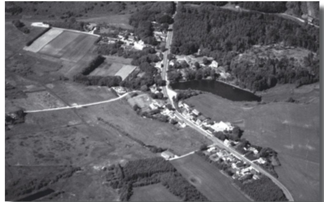
Hjedsbæk i fugleperspektiv

Når landsbyerne mødes med egne aktive engagerede medborgere og har en hel dag foran sig, er det en anden sag. Der er lange lister under S2 med faktiske forhold, F, og med bløde værdier, B, her hvor alle ved, at