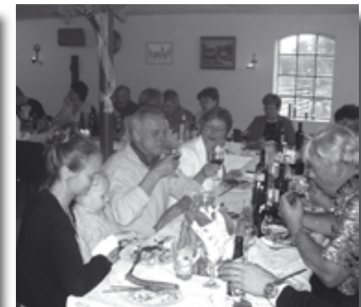
Fra Oplev forsamlingshus

Landsbyrådet inviterede under titlen Landsbyernes Fremtid